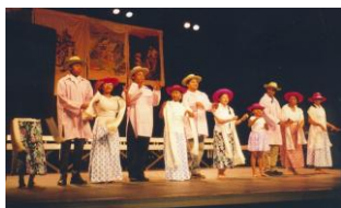
La chorale d'Orléans

On connaît l'amour des malgaches pour la musique. Le chant choral qu'ils pratiquent en toute occasion mêle le plus souvent les airs d'inspiration religieuse et ceux d'inspiration profane, et la danse n'est jamais loin. Nous avons pu avoir un exemple de ce goût pour le chant collectif lors du concert proposé en d'avril dernier à Chambray où étaient invitées les chorales malgaches d'Orléans et de Poitiers.