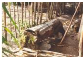
Une ruche traditionnelle dans la région de Fort Dauphin

Pour apporter un appui au développement de la filière, à la demande des groupements de paysans avec lesquels elle est en relation, l'AFDI 41 a, dans un premier temps, formé un technicien malgache qui a retransmis aux paysans puis lors d'une autre mission financé des échanges entre apiculteurs malgaches de différentes régions (échanges sud / sud).