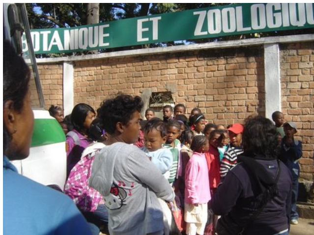
Arrivée devant l'entrée du parc.

Touraine Madagascar apportera son soutien pour animer et consolider ce nouveau partenariat.