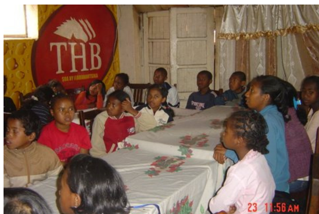
Repas de midi au restaurant pour tout monde

« Déplacement qui a permis à nos élèves de faire des comparaisons entre l'environnement et les activités économiques entre notre Andranovelona et une ville en plein essor » (le Directeur du collège).