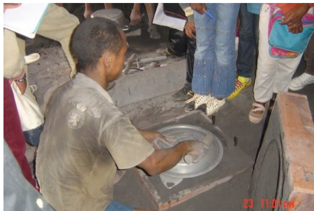
Le démoulage d'un couvercle de cocote.

Les fours à charbon de bois pour fondre l'aluminium.