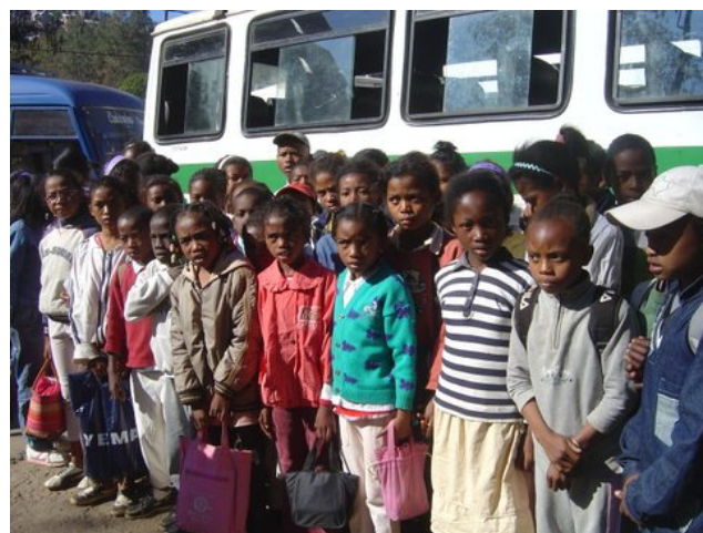
Voyage en car, direction le parc zoologique de Tsimbazaza

Ils sont allés le vendredi 29 juin visiter le parc zoologique de Tsimbazaza à Antananarivo. Voyage en car pour la journée et pique-nique pour ce groupe d'enfants et leurs accompagnateurs.